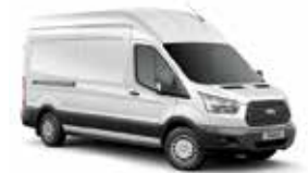
BLANCO OXFORD - 3GZ