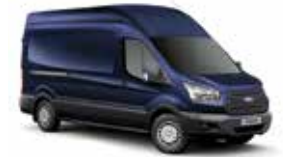
AZUL BÁLTICO - 3JV