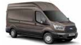
MARRÓN BRISBANE - 4AR