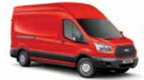
COLORADO RED - 4A7